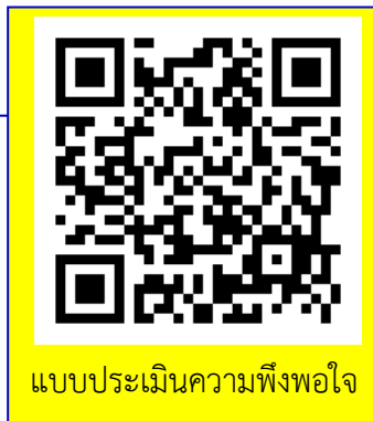
แบบประเมินความพึงพอใจ

ประชุมพิจารณาเงินกู้ สำหรับสมาชิกที่ส่งคำขอเงินกู้สามัญ เกิน 1,500,000 บาท และเงินกู้พิเศษ ครั้งที่ 1 วันที่ 12 มกราคม 2564 ครั้งที่ 2 วันที่ 28 มกราคม 2564 ** หากมีการเปลี่ยนแปลงจะแจ้งให้ทราบอีกครั้ง **