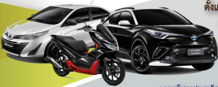
นอกเหนือจากประชาสัมพันธ์ ให้เป็นไปตามประกาศสหกรณ์ฯ

เพื่อให้สมาชิกกู้เงินไปจัดซื้อยานพาหนะรถยนต์และรถจักรยานยนต์ทั้งรถใหม่ และรถใช้แล้วเป็นของตนเอง รวมทั้งการกู้เงินเพื่อปิดไฟแนนซ์ รถยนต์ใหม่ วงเงินกู้ไม่เกิน 1,200,000 บาท ไม่เกิน 84 งวด รถยนต์ใช้แล้ว วงเงินกู้ไม่เกิน 800,000 บาท ไม่เกิน 60 งวด รถจักรยานยนต์ใหม่ วงเงินกู้ไม่เกิน 50,000 บาท ไม่เกิน 36 งวด เพื่อปิดไฟแนนซ์ วงเงินกู้ไม่เกินยอดเงินกู้คงเหลือ ไม่เกิน 60 งวด